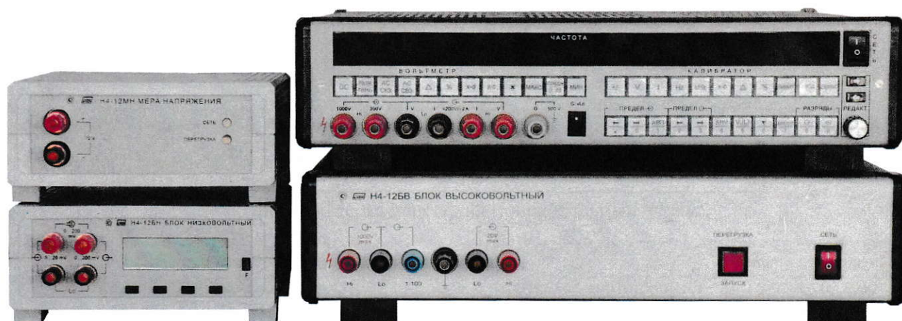
Рисунок 1 - Общий вид калибратора-вольтметра универсального Н4-12

Общий вид калибраторов представлен на рисунке 1. Места нанесения поверительных клейм указаны на рисунке 2.